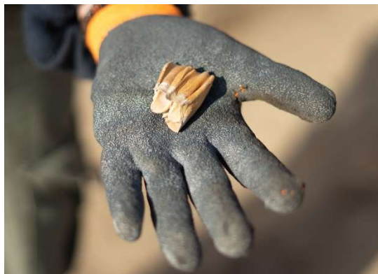
Dent de capriné.