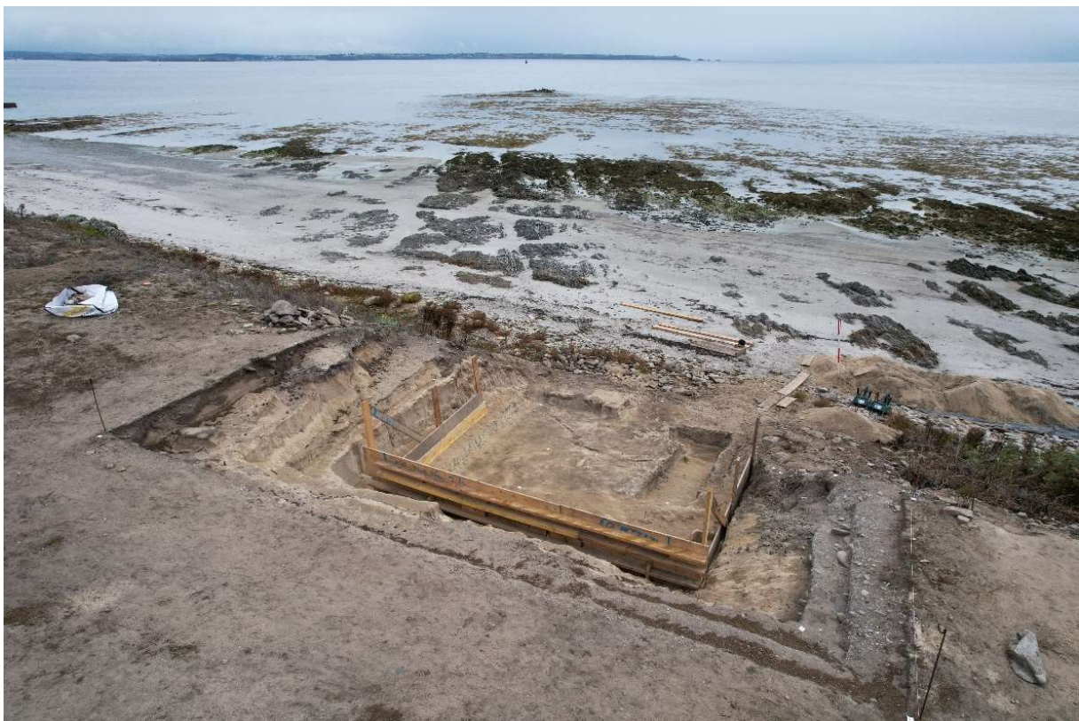
Vue de la tranchée 1 en 2022.

Le site de Porz ar Puns est situé au sud-est de l'île de Béniguet. Il se présente sous la forme d'un amas coquillier de plusieurs dizaines de mètres de longueur scellé sous la dune et visible en coupe de microfalaise. Il a été découvert suite aux tempêtes de 2014 et livré de nombreux écofactes (coquilles, faune terrestre et marine, charbons, etc. ) et artefacts (silex, céramique). Les deux premières campagnes de fouille en 2021 et 2022 ont permis de reconnaître plusieurs amas coquilliers superposés et étendus sur plusieurs centaines de mètre carrés se rapportant au Néolithique final/Campaniforme (2900-2200 av. n. è.), à l'âge du Bronze ancien (2200-1600 av. n. è.) et au haut Moyen Âge (600-800 ap. n. è.).